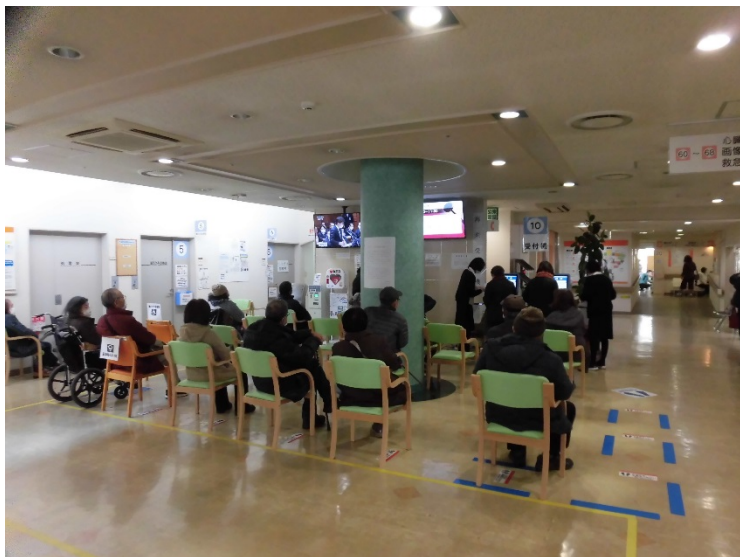
椅子の間隔を空けて密を防いでいます。