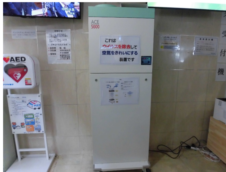
ウイルス除去装置を外来待合に設置しています。