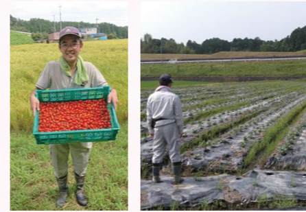
カゴいっぱい収穫されたミニトマト