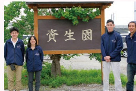
農業生産法人 資生園株式会社

農業生産法人資生園株式会社(大津市真野)は、働くことに障害のある方がサポートを受けながら仕事や日中活動が出来る就業員数は約30名、そのうち障がい者手帳を持たれている方が全体の8割を占めます。当社では、年間を通じて椎茸の栽培や伊香立地区で露地野菜の栽培を行っています。収穫した地元の新鮮な野菜や加工品は、県内の平和堂グループ様の店舗をはじめ、道の駅や小売店様に地場コーナー(美輪湖野菜)を設置させていただき販売しています。