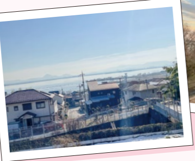
通勤時、車から望む琵琶湖