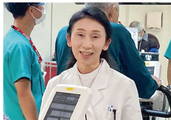
心臓リハビリテーション室にて

循環器内科とは元々心臓病の診断と治療を行う診療科でしたが、現在では全身の循環システムを守備範囲とし、血液循環のポンプである心臓のみならず、血液が流れる血管疾患もその対象疾患に含まれます。代表的な心疾患には、心臓自体を養う冠動脈が動脈硬化を来し心筋が酸素不足に陥る「狭心症」や、冠動脈が詰まって心筋が壊死に陥る「心筋梗塞」、心臓が機能低下を来す「心不全」、規則正しいはずの脈が乱れたり速度に異常を来す「不整脈」などがあります。高血圧症はそのいずれの疾患の原因にもなりま