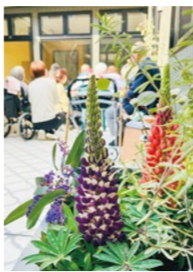
緑の植物や花が魅力的な庭

ご入居者からは、「素敵やわ」「カフェにお出かけしたみたい」「皆さんとてもよく似合っている」というお褒めの言葉をたくさん頂戴しています。また、見学に来られたご家族様からは「想像していた介護施設のイメージが全く変わった。私が入りたいくらい」とのお声も。