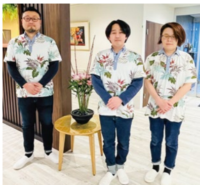
グループホームは爽やかなアロハシャツ