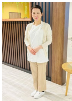
白をベースにした清潔感のある看護師のユニフォーム