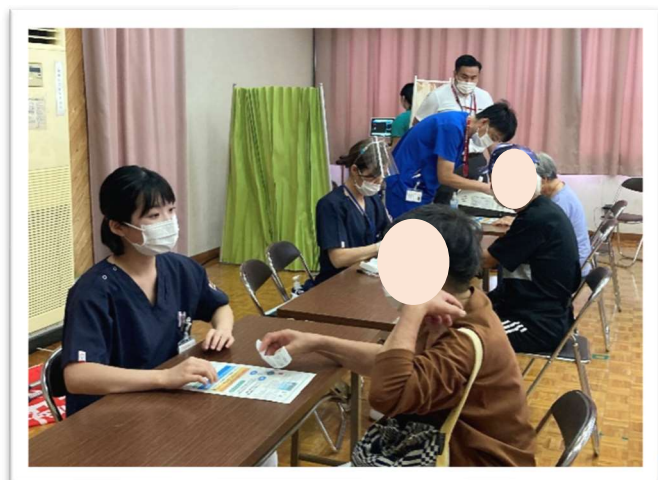
血糖検査・骨密度測定