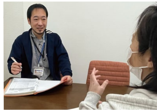
▲実習生の指導を通して事業所全体の成長を目指します

地域によってはケアマネ不足が深刻な問題となっています。その理由に、資格取得が難しいことや資格の維持が大変であること、さらにケアマネの高齢化と課題が山積みです。こうした課題は各事業所だけの問題ではなく、地域や業界全体の課題であると考え、当事業所では実習生の受け入れを積極的に