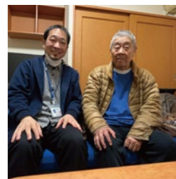
▲入退院支援のご利用者様と

医療や福祉のサービスが必要とする人は、病気や障がい、経済的困窮、社会からの孤立などの困難を複合的に抱えているケースもあります。適切な判断と他職種同士のスムーズな連携により支援につながった事例でした。