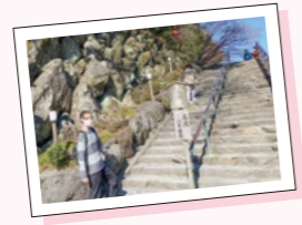
▲ この階段が、荒行のスタートです。