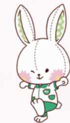
イメージキャラクター カタビヨン

公益社団法人滋賀県私立病院協会 滋賀県堅田看護専門学校 〒520-0232 滋賀県大津市真野1丁目12-30 TEL▷077-573-8545(平日9時~17時) http://www.katata-kango.ac.jp